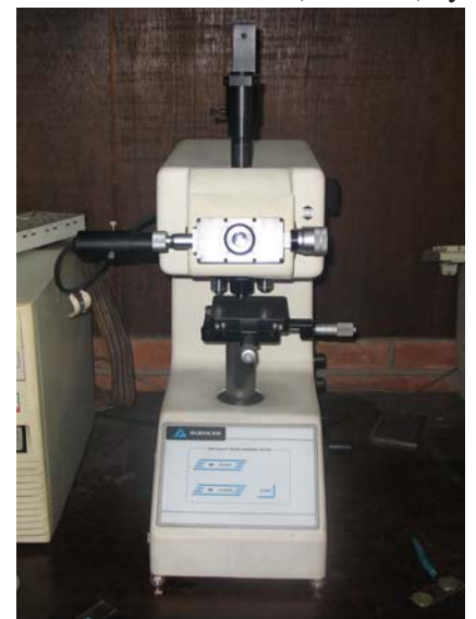
Fig. 2. Microdurómetro BUEHLER®

Las medidas de microdureza inicial y final fueron realizadas en el laboratorio Sputtering de la facultad de Ciencias de la Universidad de Ingeniería. Se utilizó el método de dureza Vickers mediante un microdurómetro marca BUEHLER® (USA, 1991), programado para aplicar una carga de 100 gramos en un tiempo de 15 segundos (Fig. 2). Cada fragmento de esmalte se dividió en cuatro cuadrantes donde fueron realizadas las cuatro indentaciones de manera aleatoria. Luego se procedió a medir sus diagonales (d1 y d2), de las que se obtuvo un promedio, este valor fue trasladado a una tabla de valores de la microdureza superficial en \text{kg}/\text{mm}^2 para cada cuadrante del espécimen (16) (Fig. 3). Se realizó análisis univariado mediante los cálculos de media y desviación estándar. La comparación entre la dureza inicial y final en cada espécimen y en cada grupo se obtuvo mediante la prueba t de Student. Para comparar la variación de la dureza superficial entre los grupos se utilizó la prueba de análisis de varianza (ANOVA), y