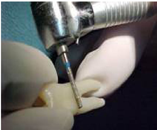
Fig. 1 Se utilizaron 20 premolares, las cuales fueron agrupadas en dos grupos de 10 cada uno.

Los 20 premolares fueron agrupados en 2 grupos de 10 cada uno. A cada premolar se le hizo dos muescas en el tercio medio de la raíz de 2mm de largo y 1 mm de profundidad para generar retención. (Fig.1-2)