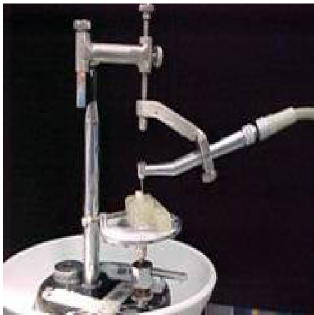
Fig 3. Las preparaciones fueron estandarizadas colocando las fresas en un paralelgrafo con un aditamento especial que permitió colocar la turbina de alta velocidad.

Una vez recibidas las coronas fueron arenadas en su parte interna con oxido de aluminio de 50 \mu\text{m} a 30 psi y luego cementadas con el cemento ionómero de vidrio Ketac™ Cem de 3M ESPE siguiendo las especificaciones del fabricante.