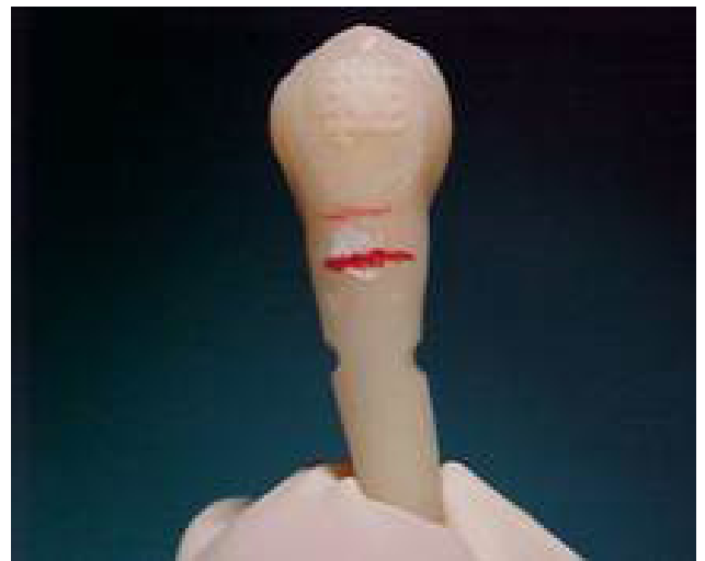
Fig 2. A cada premolar se le hizo una muesca en el tercio medio de la raíz de 2mm. de largo y 1mm. de profundidad para ofrecerle retención en los cubos de acrílico.

Los especímenes se tallaron con un grado de convergencia de 6° y con una terminación marginal tipo chamfer (12). Se procedió a realizar las impresiones con silicona de condensación (Oranwash y Zetaplus) de cada espécimen para obtener los modelos de trabajo, con la técnica de doble mezcla. La aleación que se utilizó para todos los colados fue el cromo – níquel, como su principal componente.