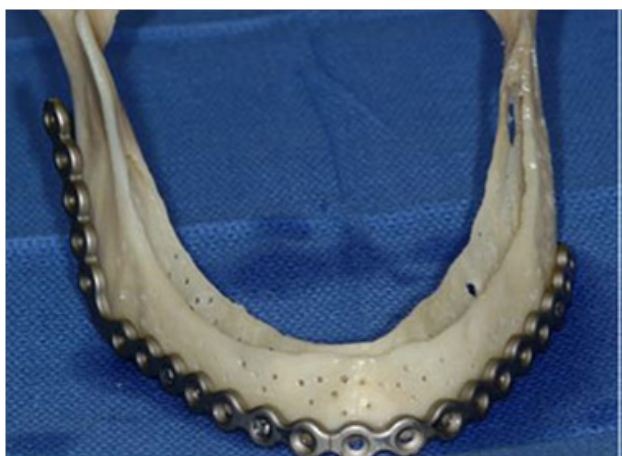
Fig 2BA. Modelos de STL de la mandíbula. Adaptación de una placa de reconstrucción.