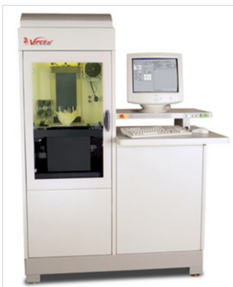
Figura 1 El centro de estereolitografía 3D Systems SLA® Viper™

El objetivo final de cualquier procedimiento quirúrgico es reproducir la forma y función que se planifica en el periodo preoperatorio y el objetivo