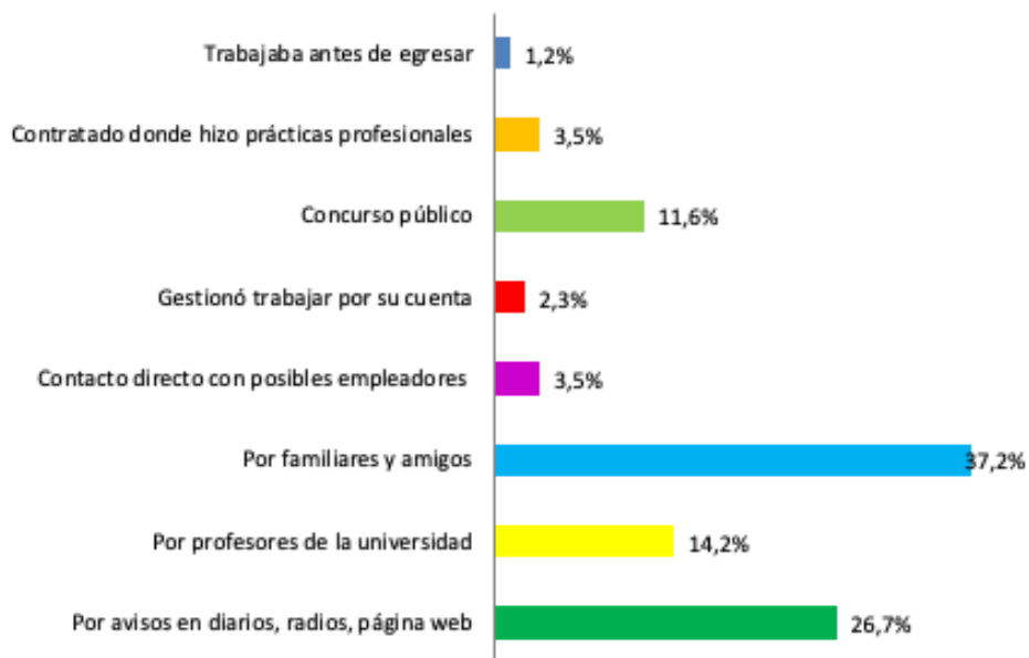
Gráfico 2. Forma de conseguir el primer empleo