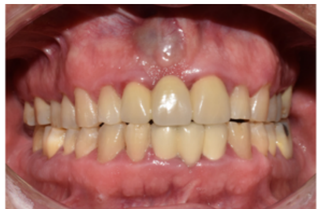
Figura 1. Foto intraoral frontal. Lesión nodular de color violácea de 1.5x1x1 cm de diámetro

En la radiografía panorámica se observó una imagen radiolúcida proyectada en el proceso dentoalveolar en zona de pieza 11 alcanzando la cima del reborde alveolar y extendiéndose hasta las superficies radicales de las piezas 12 y 21. En la radiografía periapical se comprobó la presencia de la cortical fina en los bordes y se visualizó la continuidad del espacio para el ligamento periodontal de las piezas 12 y 21 (figura 2). En la TCHC, se comprobó la proximidad con el conducto nasopalatino y la expansión, adelgazamiento y erosión de la tabla ósea vestibular (figura 3). Dadas las características imagenológicas las opciones diagnósticas podrían ser: Ameloblastoma Uniquístico, Queratoquiste Odontogénico, Quiste Óseo Simple o Quiste Residual. Unificando los datos de la anamnesis con signos