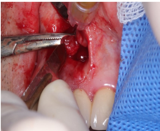
Figura 4. Enucleación de quiste residual

clínicos e imagenológicos se concluyó como diagnóstico presuntivo un Quiste Residual.