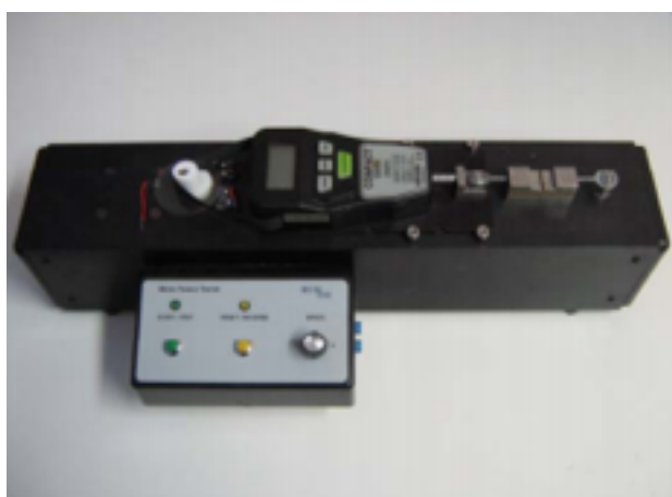
Figura 3. Microtensiómetro Microtensile Tester (BISCO, EE. UU)