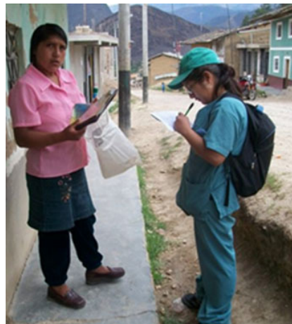
Fig. 1. Estudiante del Internado Rural de la Facultad de Estomatología de la UPCH realizando una encuesta como parte del diagnóstico situacional de una comunidad.

de nacer, se extiende durante toda la vida y lleva a la persona a cuidar y valorar su salud mediante la asimilación, interiorización y práctica de hábitos correctos de manera voluntaria, evitando situaciones y comportamientos de riesgo (5). Pero como la EpS es una intervención social y su arma fundamental es la modificación de la conducta, no se genera un cambio imponiéndolo, por el contrario, presupone el conocimiento de la cultura de la comunidad o población objetivo (partiendo desde una concepción multicultural, de respeto y tolerancia hacia el otro) y la determinación de sus intereses. En otras palabras, primero se tiene que establecer un “diagnóstico educativo” (diagnóstico de la comunidad) para poder determinar cuáles son las necesidades reales de enseñanza que presenta la población y poder seleccionar los métodos, medios y procedimientos más eficaces para llegar a ese grupo humano determinado (Fig.1).