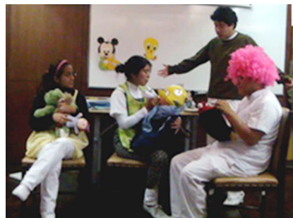
Fig. 3 Estudiantes de 5to.año de Estomatología de la UPCH planificando y dramatizando un socio-drama.

Dentro de estos métodos se encuentra: el diálogo, clase, charla o conferencia, grupos de discusión, lluvia de ideas, demostraciones, lecturas-discusión, videos-discusión, estudios de caso, foros-casette, socio-dramas, teatro, talleres, juegos, narración de fábulas y cuentos (Fig.3 y 4) (9,13).