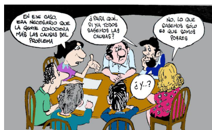
Fig. 4 Grupo de discusión. Tomado de: Kroeger A, Luna R. Atención primaria de salud: Principios y métodos, 1992.

En los métodos indirectos , existe una distancia en tiempo y/o espacio entre el educador y el educando y se hace uso de la palabra hablada, escrita o la imagen a través de algún medio técnico (medio de comunicación). Se utilizan para transmitir información a un gran número de personas. Sin embargo, para Smyth y Fernández, debido a que no existe un intercambio de información en estos métodos, tienen poca capacidad de modificar conductas. Estos métodos son: el cartel, folletos, la radio, televisión, periódicos, cine, internet, danzas, fotografías, canciones, proverbios, franelógrafo, rotafolio, exposición y marionetas o títeres (6,9).