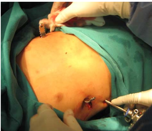
Figura 4. Barra metálica retroesternal en posición cóncava y toroscopio

Todos los pacientes tuvieron compresión crdiaca en la Tomografía axial computarizada. La condición clínica en el seguimiento fue asintomático en la totalidad de los pacientes. Todos los pacientes tenían satisfacción de su imagen corporal, en el postoperatorio.