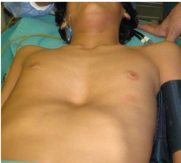
Figura 1. Paciente intraoperatorio con PE simétrico

La edad promedio fue 11,8 (rango: 6 - 22 años); 8 de sexo masculino. El PE fue simétrico en 6 pacientes (Figura 1) y asimétrico en 4. El IH promedio fue 5,1