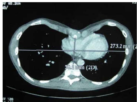
Figura 2. Determinación de Índice de Haller mediante TAC

En 8 pacientes se usó un toracoscopio de 5 mm, en 7 pacientes se instaló en el hemitórax derecho y en 3 casos bilateral. A todos los pacientes se les colocó una barra, se emplearon dos estabilizadores fijados con alambre quirúrgico en 7 casos y en 3 con nylon 1 (Figura 3, 4, 5). En 8 pacientes se instaló drenaje pleural cerrado; el tiempo operatorio promedio fue 2,5 horas (2-4 horas). El postoperatorio inmediato se realizó en la unidad de cuidados intensivos en 3 pacientes, en la unidad de cuidados intermedios en 2 pacientes y en sala de hospitalización en 5 pacientes. El catéter epidural