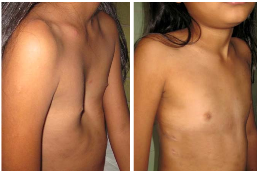
Figura 7. Paciente con PE, pre-operatorio y 4 meses de post-operatorio.

La técnica mínimamente invasiva fue diseñada para pacientes menores de 15 años, sin embargo,