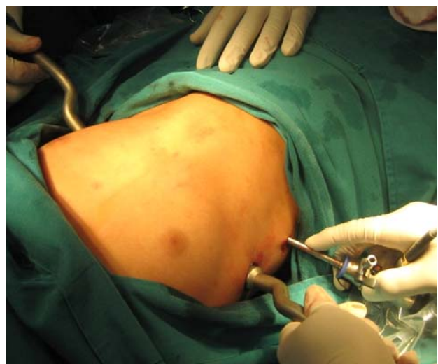
Figura 5. Barra metálica retroesternal en posición convexa, con volteadores y toroscopio.