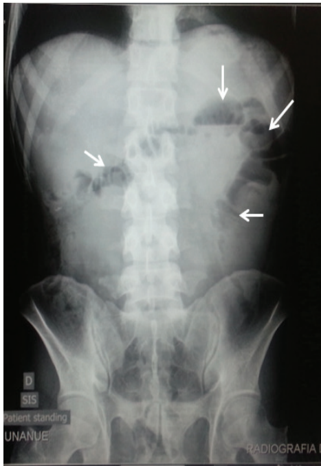
Figura 1. Radiografía de abdomen: Se evidencian niveles hidroaéreos (flechas) en flanco izquierdo y a lo largo de colon transverso y descendente.

El segundo informe de anatomía patológica de la biopsia de peritoneo fue descrita como metástasis peritoneal de carcinoma poco diferenciado con