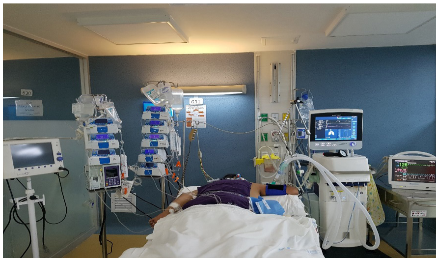
Figura 2. Paciente con Enfermedad de Carrión aguda y síndrome de dificultad respiratoria aguda severo con hipoxemia refractaria en ventilación mecánica en posición PRONA.